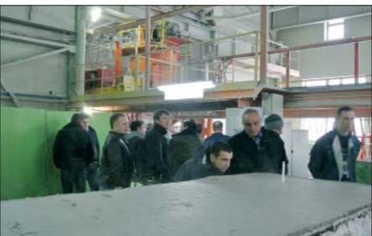
Цех газосиликата вызвал не меньший интерес специалистов