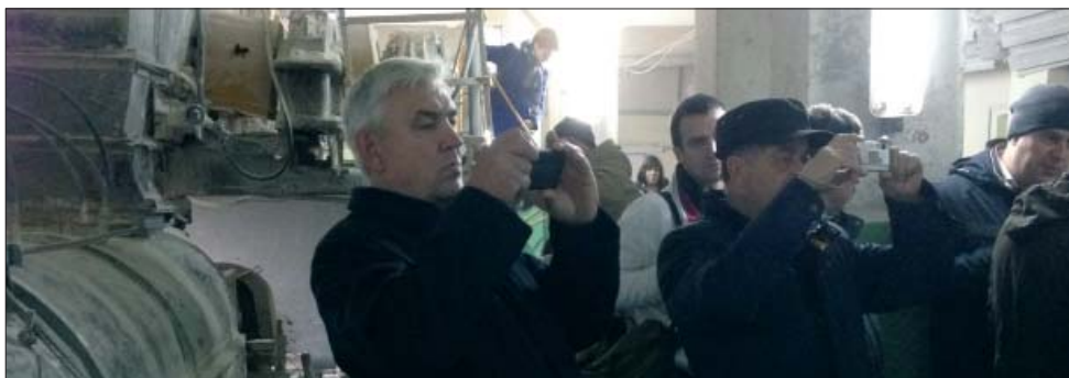
Многие технологические решения, внедренные на комбинате, специалисты предпочли сфотографировать