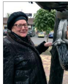
Завершением конференции СИЛИКАТэкс-2015 стала экскурсия по Воронежу. Веселый памятник мультяшному котенку с улицы Лизюкова стал настоящим местом паломничества, и каждый старался прикоснуться к нему «на удачу»