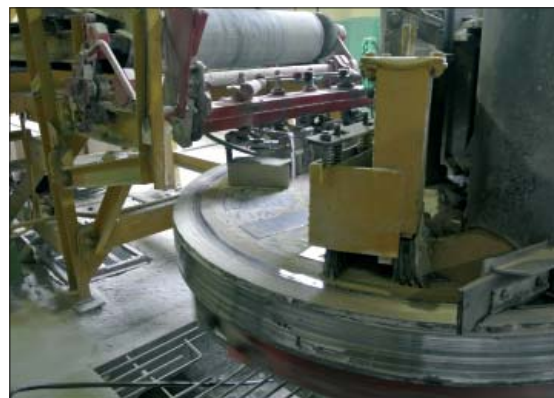
Не многие предприятия, где работают револьверные прессы, могут похвастаться успешно работающим оборудованием для съема кирпича-сырца