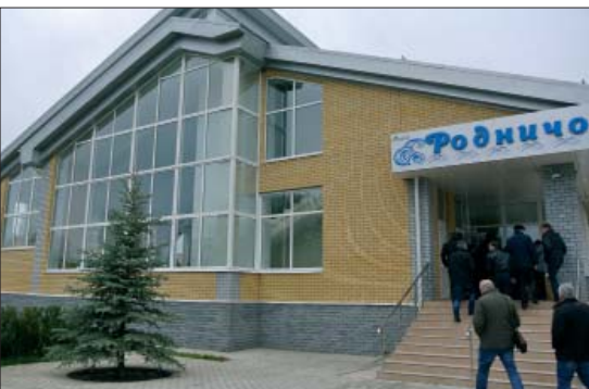
Изумление участников конференции от социальной инфраструктуры ВКСМ можно понять. Мало кто на предприятиях имеет бассейн, спортивно-оздоровительный комплекс, поликлинику и прочие блага, да еще и бесплатно!