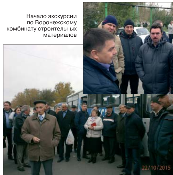
Начало экскурсии по Воронежскому комбинату строительных материалов

В 2016 г. конференция СИЛИКАТэкс «Развитие производства силикатного кирпича в России» состоится в десятый раз! Оставайтесь с нами, друзья!