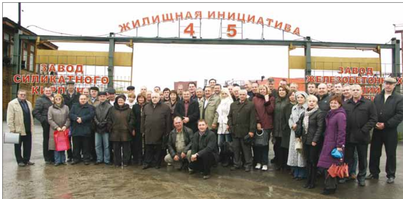
По традиции – общая фотография участников конференции на заводе.