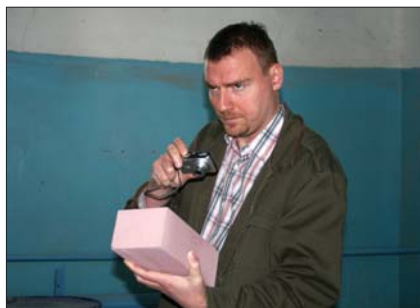
Чтобы правильно сделать коммерческое предложение по смесителям, нужно запечатлеть продукцию во всех деталях. М. Валтер , компания Maschinenfabrik Gustav Eirich GmbH