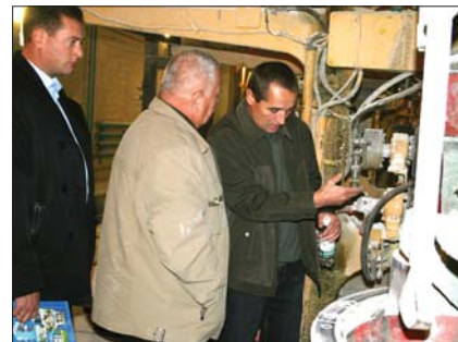
Не только современные прессы заинтересовали производителей, но и «старые друзья» – револьверные прессы