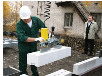
С возможностями специального подъемника для силикатных блоков, который значительно облегчает перемещение блоков в построчных условиях, познакомилась гости завода