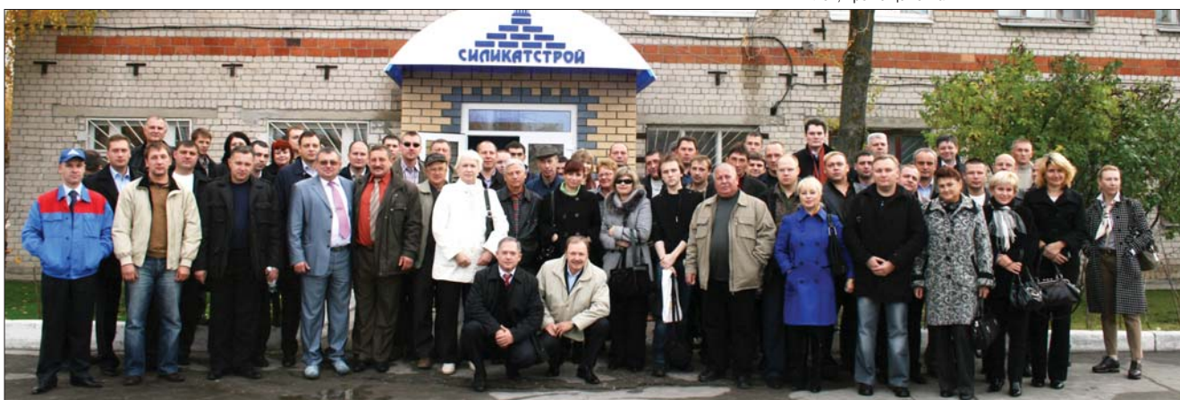
Посещение завода «Силикатстрой» участниками конференции