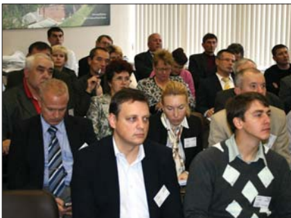
Участники конференции во время пленарных докладов

Для оптимизации процесса обжига разработана центральная горелка и периферийные подвижные горелки, которые позволяют увеличить зону обжига печи. Развивая бизнес в России, компания предлагает также помощь в организации кредитного финансирования проекта. Обеспечение кредита осуществляется швейцарским кредитным экспортным агентством. Авансовый платеж, вносимый заказчиком при подписании договора на строительство или реконструкцию печей Maerz, составляет 15–20%. Основное погашение кредита производится уже после запуска печи и начала получения прибыли. Предоставление возможности осуществления такой щадящей программы финансирования проектов российским фирмам свидетельствует о серьезном подходе к развитию бизнеса в России.